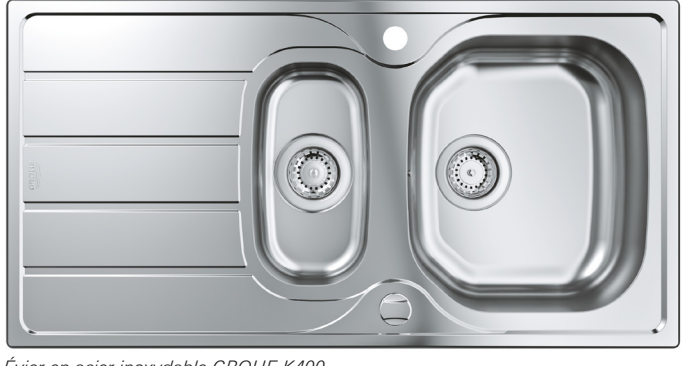
Évier en acier inoxydable GROHE K400

Pour compléter les 60 centimètres qui entourent la robinetterie de la cuisine, GROHE propose des éviers et des systèmes d'évacuation assortis. Les mitigeurs de cuisine GROHE Eurosmart se complètent parfaitement, de part leur design et leur fonction, avec les gammes d'éviers en acier inoxydable K200 et K400 et les solutions à montage sous plan de travail. Pour les clients qui préfèrent un évier foncé et sobre, les deux séries d'éviers sont également disponibles en composite gris granit et noir granit. Les éviers sont disponibles en différentes tailles afin que les éléments de cuisine s'adaptent à tous les projets.