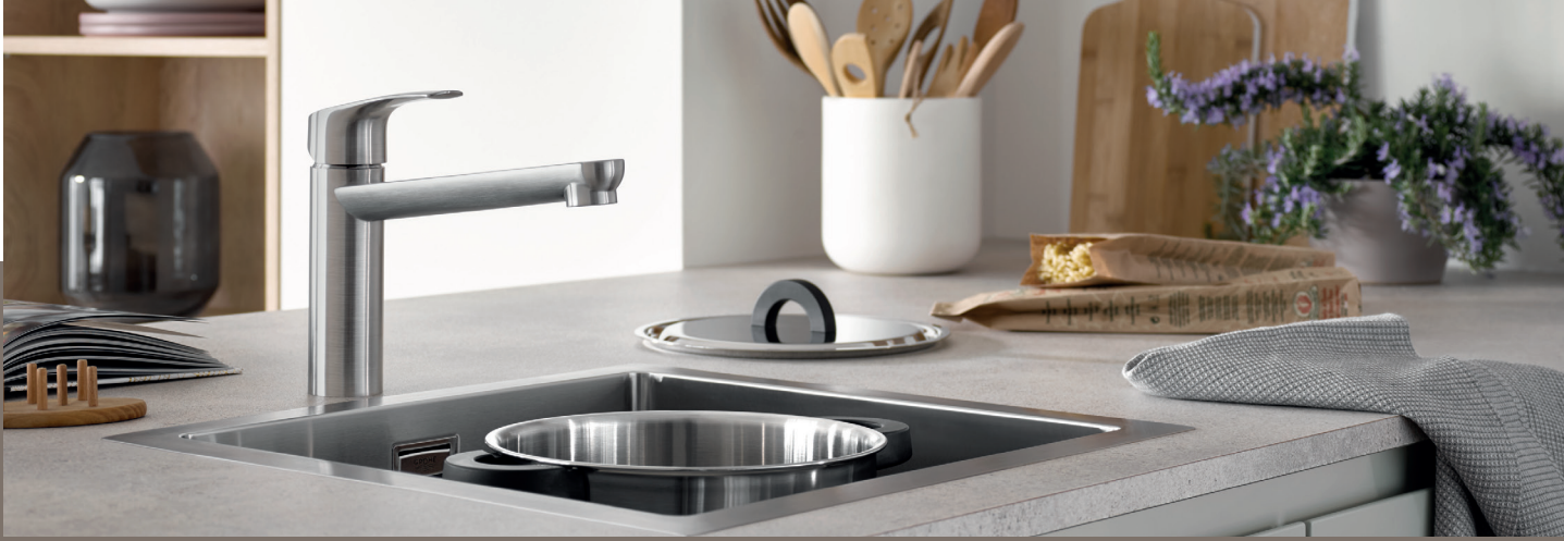
Mitigeur d'évier GROHE Eurosmart et évier composite GROHE K700