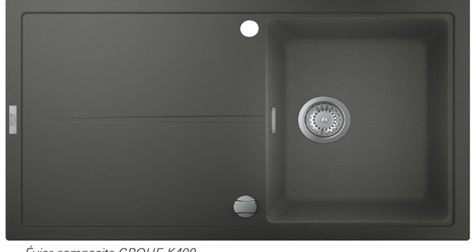
Évier composite GROHE K400