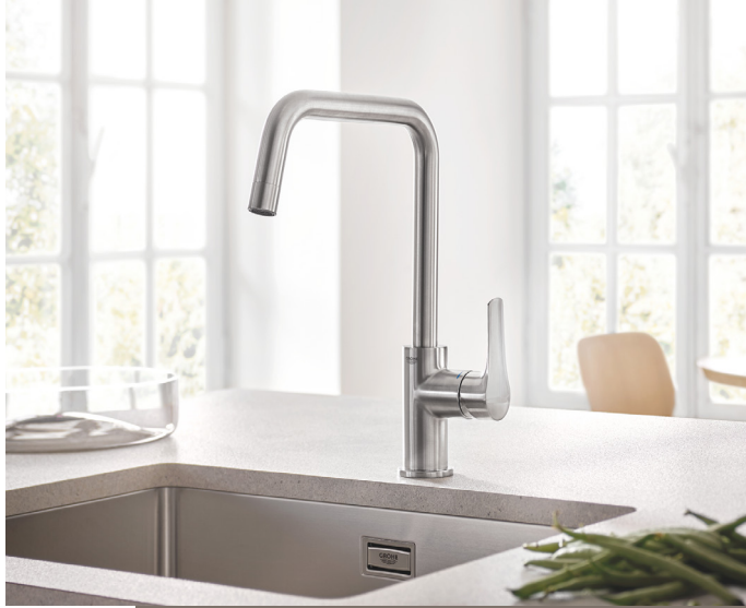
GROHE Eurosmart haut bec en U, en SuperSteel