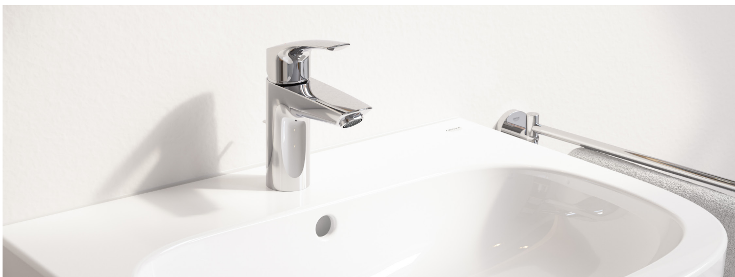
Mitigeur de lavabo GROHE Eurosmart

La gamme comprend désormais des solutions pour lavabo, douche, baignoire et bidet parfaitement assorties à Euro Ceramic, tant dans leur forme que dans leur fonction.