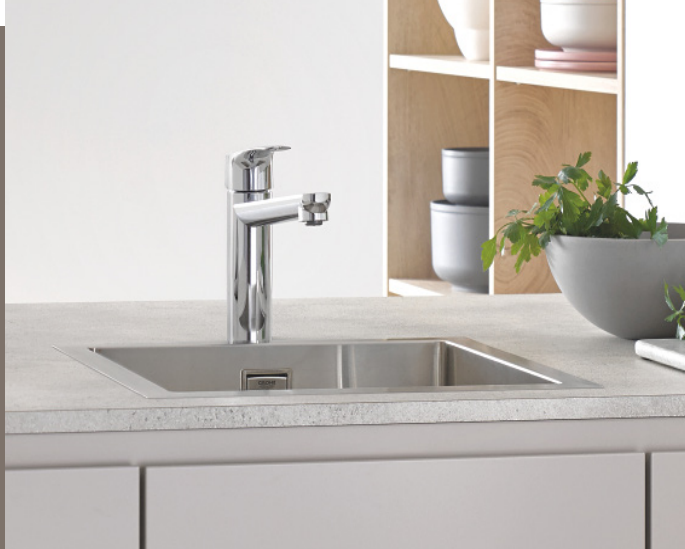
GROHE Eurosmart bec moyen, en chrome

Le robinet GROHE Eurosmart est disponible dans plusieurs design actualisés : des robinets à bec bas, moyen ou haut, en forme de U ou de C. Avec ce large choix de produits, chacun peut trouver son robinet de cuisine GROHE Eurosmart préféré. Ce nouveau choix de design concerne également les finitions du robinet. Eurosmart est désormais disponible en chrome brillant ou en style SuperSteel mat contemporain, tous deux avec une surface facile à nettoyer et résistante aux rayures. Avec son design fin et moderne, le robinet offre également une nouvelle fonctionnalité de bec pivotant, pour une flexibilité totale.