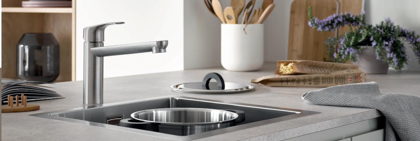
Mitigeur d'évier GROHE Eurosmart et évier composite GROHE K700