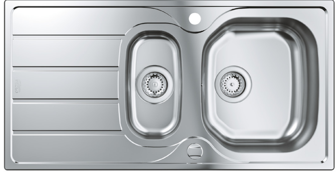
Évier en acier inoxydable GROHE K400

Pour compléter les 60 centimètres qui entourent le robinet de la cuisine, GROHE propose des éviers et des systèmes d'évacuation assortis. Les robinets de cuisine GROHE Eurosmart se complètent parfaitement, de part leur design et leur fonction, avec les gammes d'éviers en acier inoxydable K200 et K400 et les solutions à montage sous plan. Pour les clients qui préfèrent un évier foncé et sobre, les deux séries d'éviers sont également disponibles en éviers composites en gris granit et noir granit. Les éviers sont disponibles en différentes tailles afin que les éléments de cuisine s'adaptent à tous les projets.