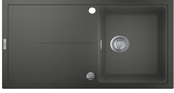
Évier composite GROHE K400