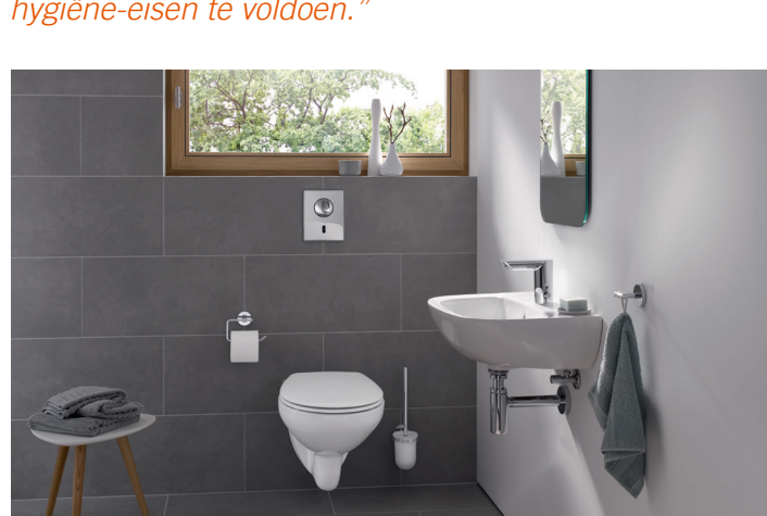
GROHE touch free badkameroplossingen

We moeten architecten en consumenten ondersteunen om met intelligente producten aan de toegenomen hygiëne-eisen te voldoen.”