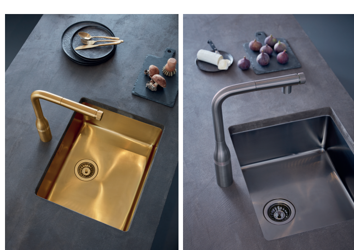
GROHE SmartControl Keuken in Cool Sunrise en Hard Graphite

Deze ooit louter functionele ruimte wordt een leefruimte. Dat verhoogt de verwachtingen van de consument naar producten. Ze zijn op zoek naar slimme, intuïtieve hulpmiddelen die hun dagelijkse routines vereenvoudigen. Tegelijkertijd willen ze actief betrokken zijn bij het ontwerpproces, en moeten de producten hun individuele stijl weerspiegelen, net zoals in hun andere leefruimtes.”