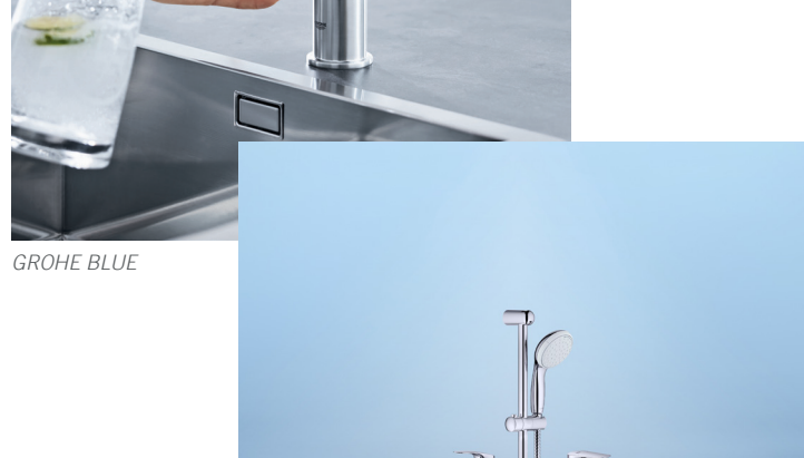
GROHE's eerste Cradle to Cradle Certified®-producten

GROHE's milieuvriendelijke hoogtepunt in de keuken is GROHE Blue , onlangs bekroond met de German Sustainability Award Design. GROHE Blue staat voor duurzaamheid met één druk op de knop. Het watersysteem levert gekoeld, gefilterd en, indien gewenst, perfect water, rechtstreeks uit de keukenkraan en met een bruist smaak. Dankzij deze intelligente functionaliteit verkleint deze grondstofbesparende oplossing niet alleen de ecologische voetafdruk, maar verandert het ook fundamenteel de manier waarop water wordt geconsumeerd. Zo bevordert het een verandering in het consumentengedrag in de richting van duurzame consumentie. Een gezin van vier gebruikt 800 plastic flessen per jaar 1 . Dankzij GROHE Blue is dat niet meer nodig.