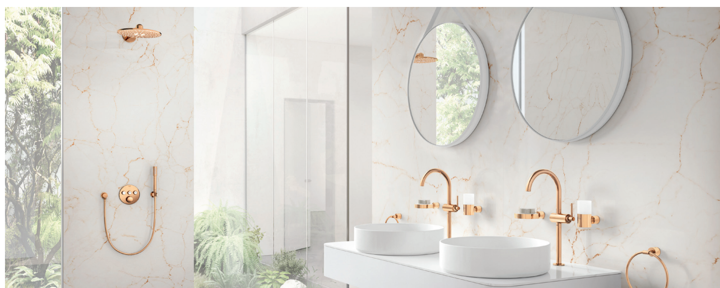
GROHE's complete badkameroplossing in Warm Sunset

Daarnaast biedt GROHE de consument ook de vrijheid om zijn eigen individuele keuken - en badkamerruimte te creëren met de duurzame GROHE Colors Collection .